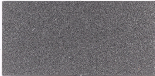
F068 ~ GRIGIO MEDIO 200 ~