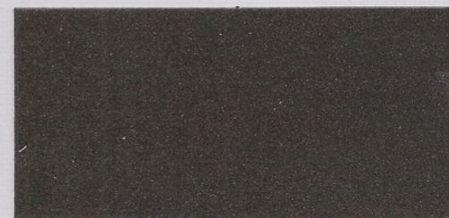
F068 ~ GRIGIO SCURO 100 ~ + VERNICE FLATTING OPACA

AMICA ferromicaceo da ottimi risultati estetici se sovrapposto con Vernici Flattting lucida o opaca. Questa soluzione aumenta le prestazioni, le resistenze del film e ne consente una facile pulizia.