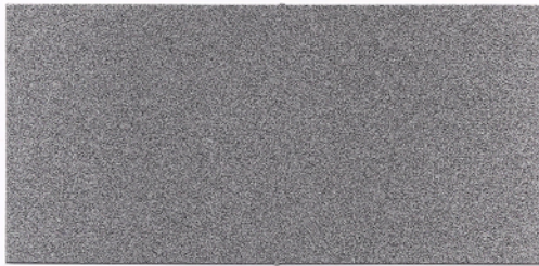
F069 ~ GRIGIO CHIARO 300 ~