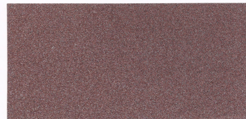
F072 ~ RAME 1400 ~