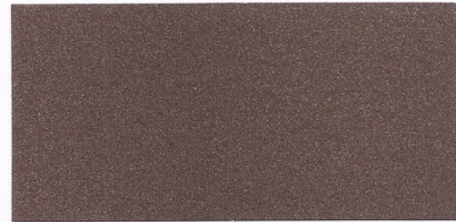
F073 ~ MARRONE 600 ~