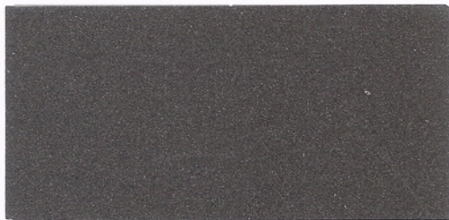
F067 ~ GRIGIO SCURO 100 ~