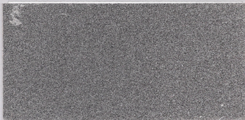
F069 ~ GRIGIO CHIARO 300 ~ + VERNICE FLATTING LUCIDA